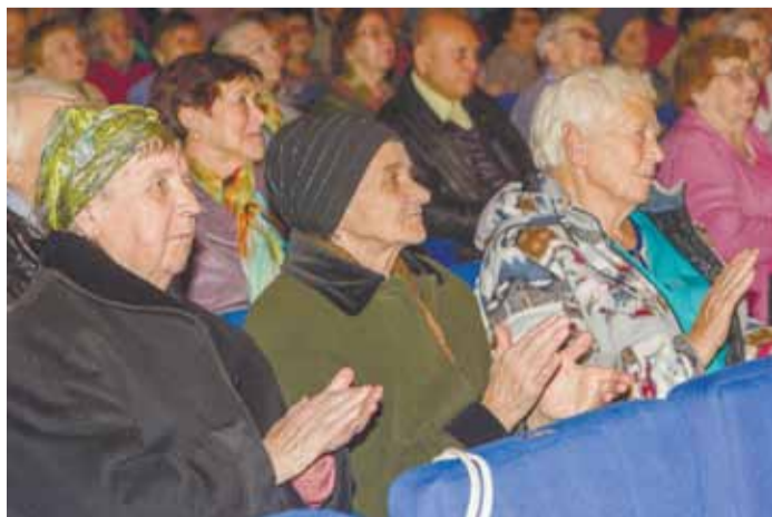
Зал был полон