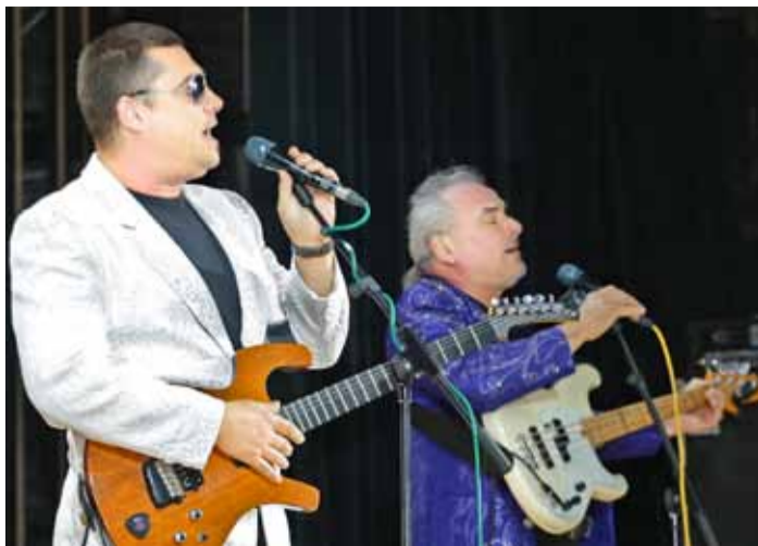
Музыканты ВИА «Синяя птица»