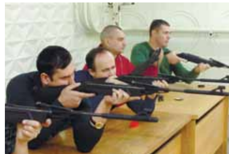
Заводская сборная по стрельбе