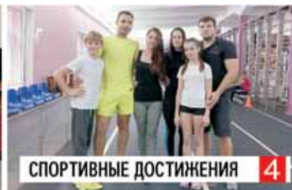
СПОРТИВНЫЕ ДОСТИЖЕНИЯ 4