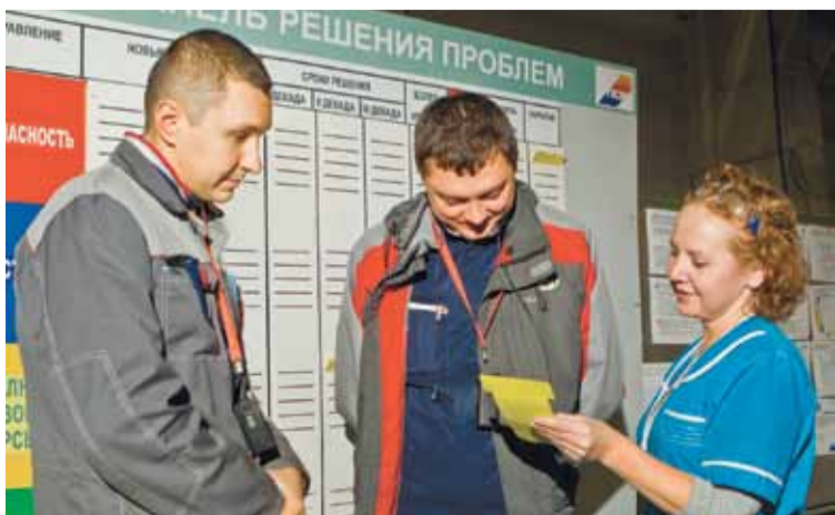
Производственные вопросы решаем вместе