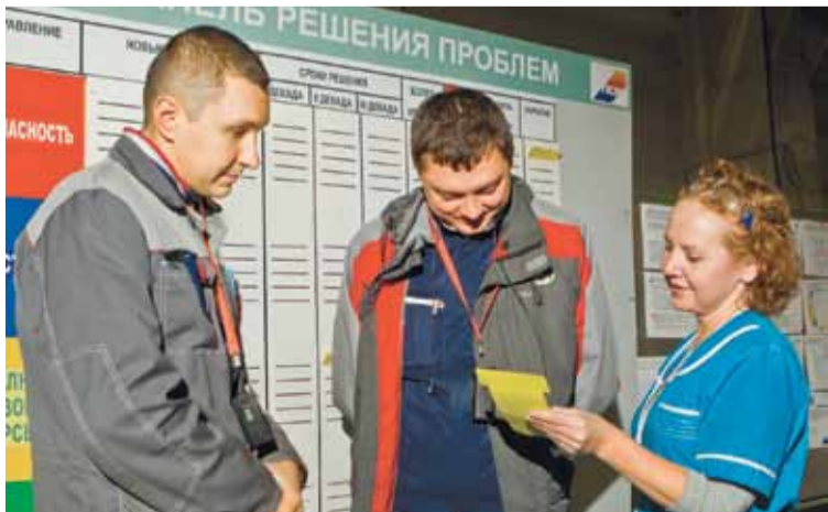
Производственные вопросы решаем вместе