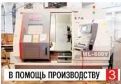
В ПОМОЩЬ ПРОИЗВОДСТВУ 3