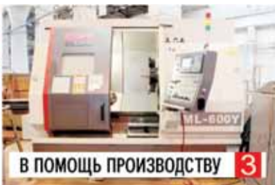
В ПОМОЩЬ ПРОИЗВОДСТВУ 3