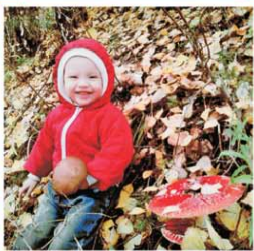
Внучка Людмилы Зименковой