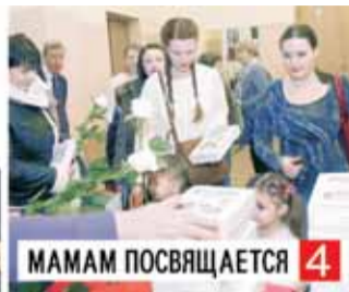
МАМАМ ПОСВЯЩАЕТСЯ 4