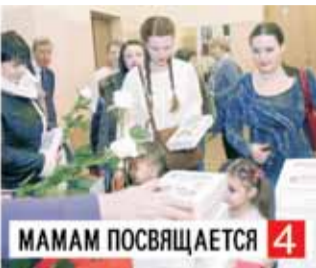
МАМАМ ПОСВЯЩАЕТСЯ 4