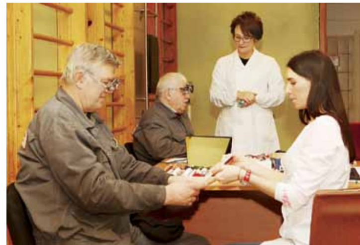
Диагностика зрения рабочих

Три года назад впервые подобные очки стали использовать на нашем заводе станочники. Порядка трехсот человек были обеспечены специальными СИЗ. Однако все они носили идентичные экземпляры очков, а ведь подход к подбору линз должен быть индивидуальным.