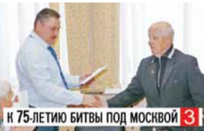
К 75-ЛЕТИЮ БИТВЫ ПОД МОСКВОЙ 3