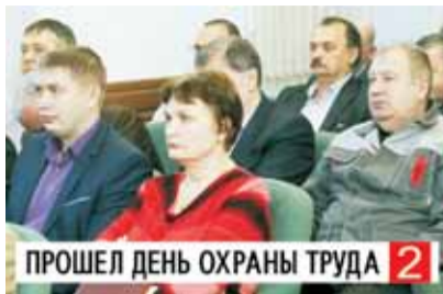
ПРОШЕЛ ДЕНЬ ОХРАНЫ ТРУДА 2