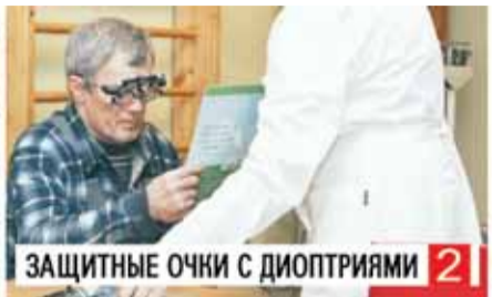
ЗАЩИТНЫЕ ОЧКИ С ДИОПТРИЯМИ 2