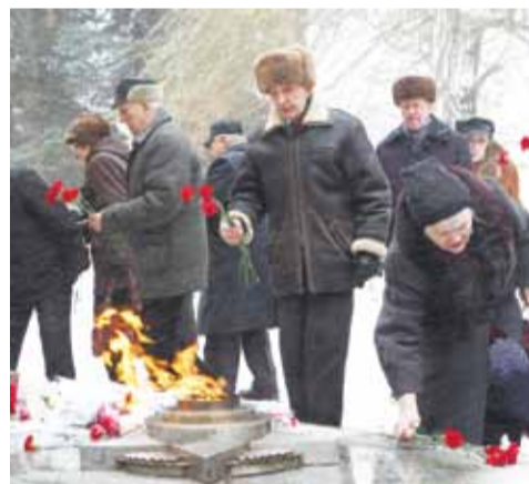
Возложение цветов к заводскому Монументу