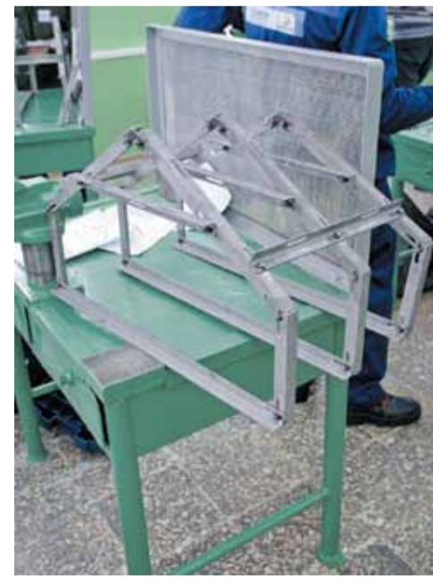
Ферма в сборе