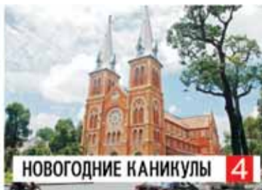
НОВОГОДНИЕ КАНИКУЛЫ 4