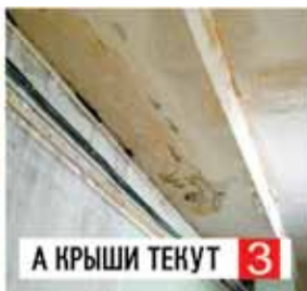
А КРЫШИ ТЕКУТ 3