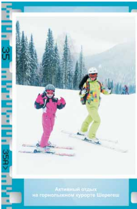
Активный отдых на горнолыжном курорте Шерегеш

Новая тема фотоконкурса «Мой настоящий мужчина» Присылайте свои фотографии с описанием до 15 февраля на e-mail: gazeta@eatom.ru