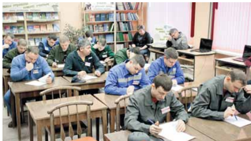
Выполнение теоретического задания

31 января завод провел конкурс среди слесарей по сборке металлоконструкций предприятий, входящих в контур управления Атомэнергомаша.