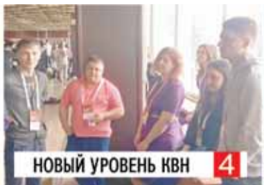
НОВЫЙ УРОВЕНЬ КВН 4