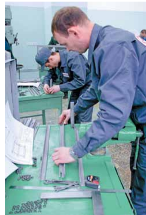
Наши конкурсанты собирают ферму