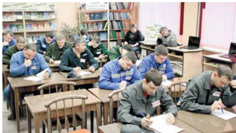
Выполнение теоретического задания

31 января завод провел конкурс среди слесарей по сборке металлоконструкций предприятий, входящих в контур управления Атомэнергомаша.