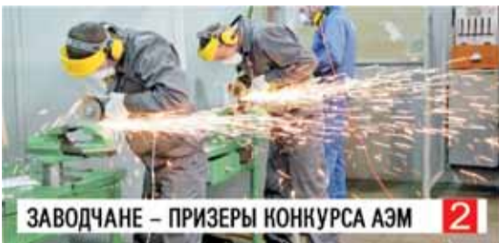
ЗАВОДЧАНЕ – ПРИЗЕРЫ КОНКУРСА АЭМ 2