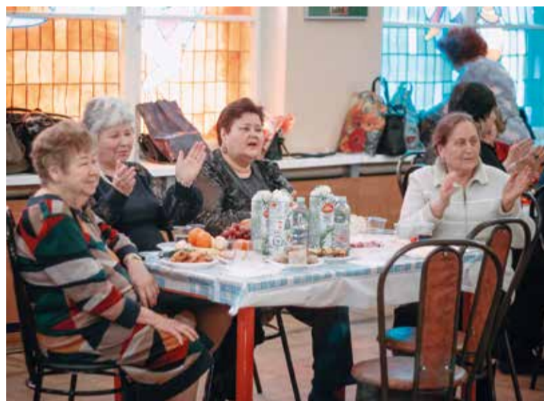
Ветераны с удовольствием подпевали артистам

Коллектив Дома культуры подготовил праздничную музыкальную программу. Самые благодарные зрители для артиста – ветераны, потому что