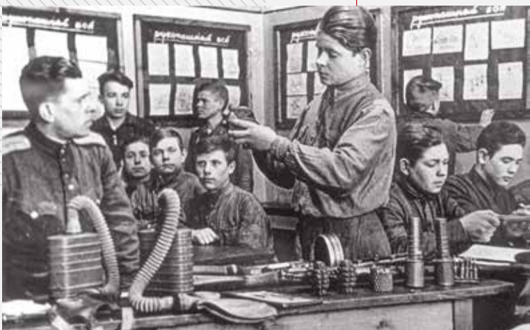
На военно-учебном пункте всеобща проходят военную подготовку допризывники 1925-1926 г. р.

В июле состоялось вручение первой группе активных участников обороны столицы медалей «За оборону Москвы». С завода за выполнение важного задания Государственного Комитета Обороны награждены 24 человека.